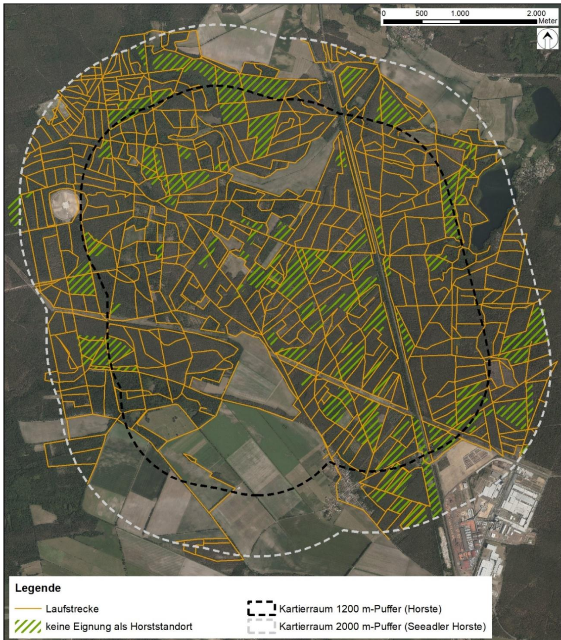
Abb. 2: Laufstrecken der Horsterfassung (2024)