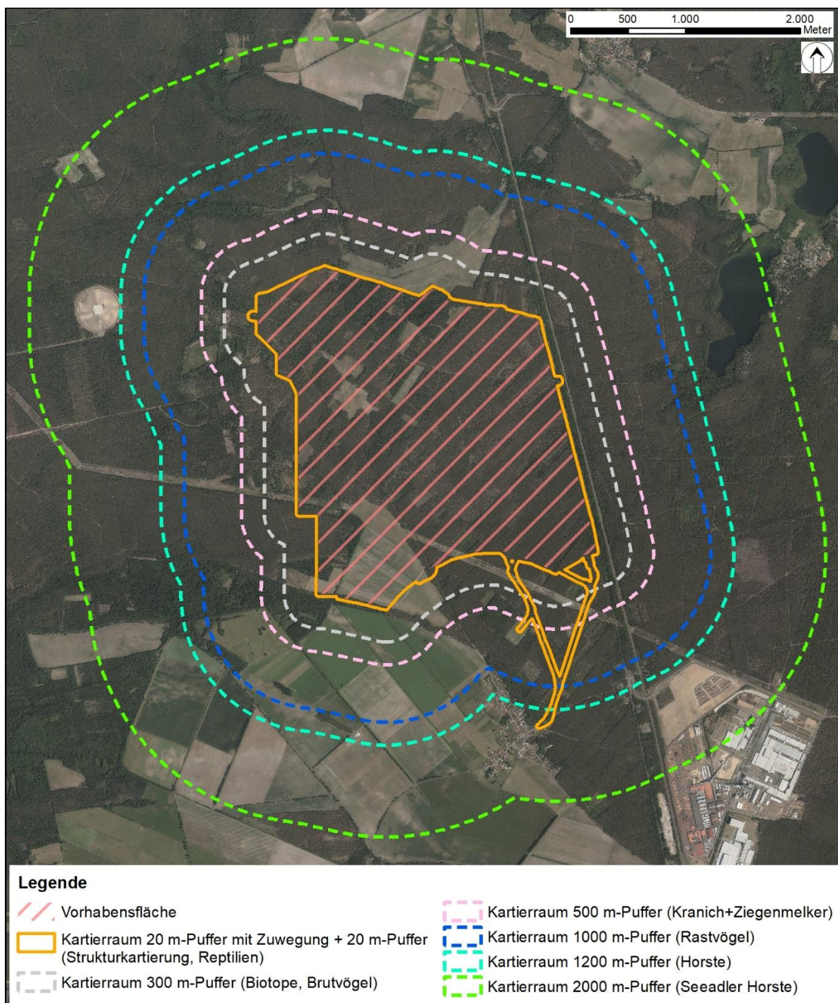
Abb. 1: Untersuchungsräume der floristischen und faunistischen Untersuchungen 2024